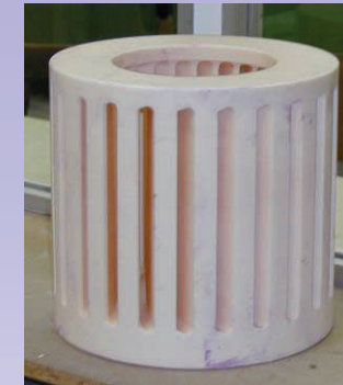
Molinos gran escala