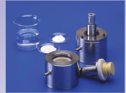
Molinos alta pureza