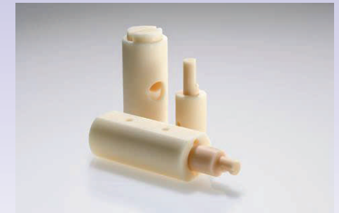
Dosificadores / Llenadores