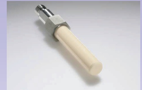
Pistones alta presión