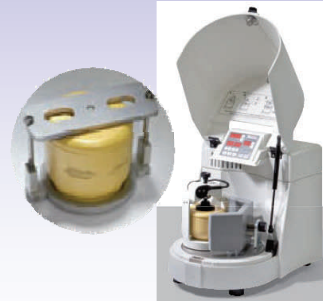
Vasos y elementos triturantes